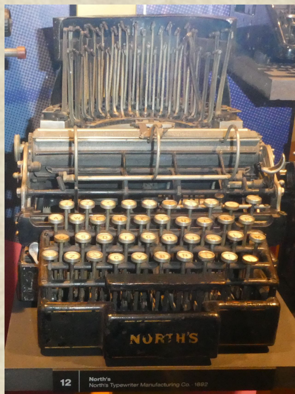
12 North's North's Typewriter Manufacturing Co. - 1892