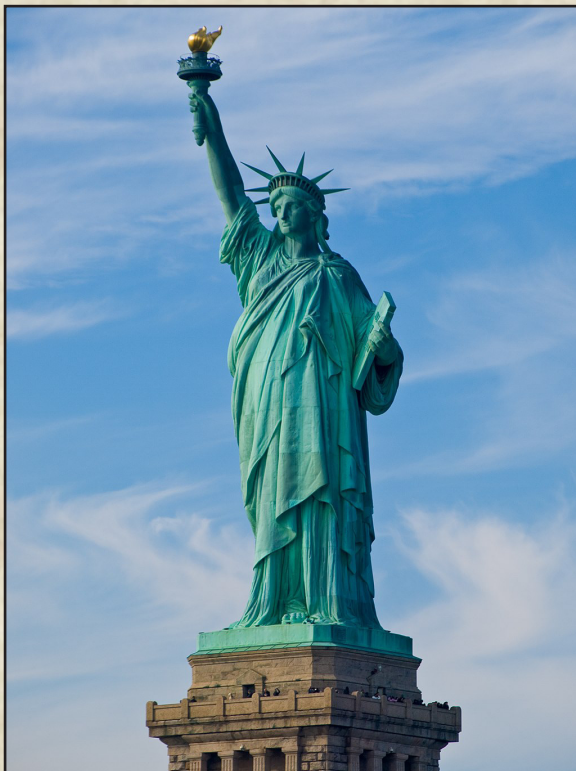
William Warby ( https://commons.wikimedia.org/wiki/File:Statue_of_Liberty_2007.jpg ), „Statue of Liberty 2007“, https://creativecommons.org/licenses/by/2.0/legalcode

Die Statue stellt die in Roben gehüllte Figur der Libertas, der römischen Göttin der Freiheit, dar. Die auf einem massiven Sockel stehende Figur aus einer Kupferhülle auf einem Stahlgerüst reckt mit der rechten Hand eine vergoldete Fackel hoch und hält in der linken Hand eine Tabula ansata (Inscriptentafel, https://de.wikipedia.org/wiki/Tabula_ansata ) mit dem Datum der amerikanischen Unabhängigkeitserklärung. Zu ihren Füßen liegt eine zerbrochene Kette. Die Statue gilt als Symbol der Freiheit und ist eines der bekanntesten Symbole der Vereinigten Staaten. Mit einer Figurhöhe von 46,05 Metern und einer Gesamthöhe von 92,99 Metern gehört sie zu den höchsten Statuen der Welt, bis 1959 war sie die höchste.