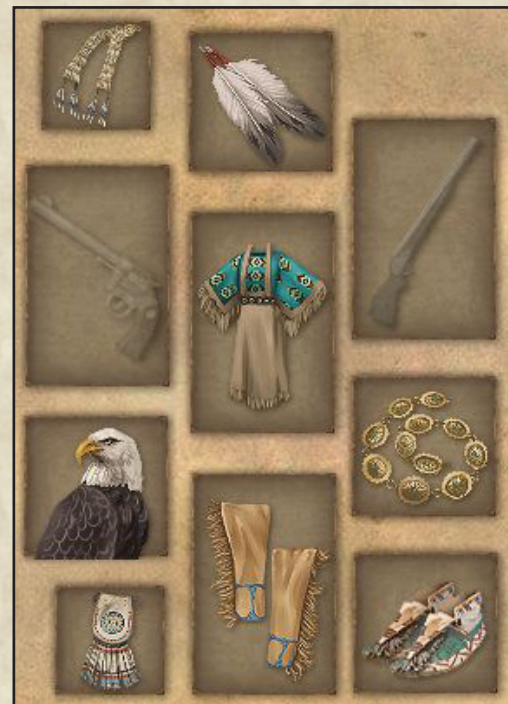
Polly Coppers Set, im Spiel als Polly Copper bekannt

https://en.wikipedia.org/wiki/Polly_Cooper