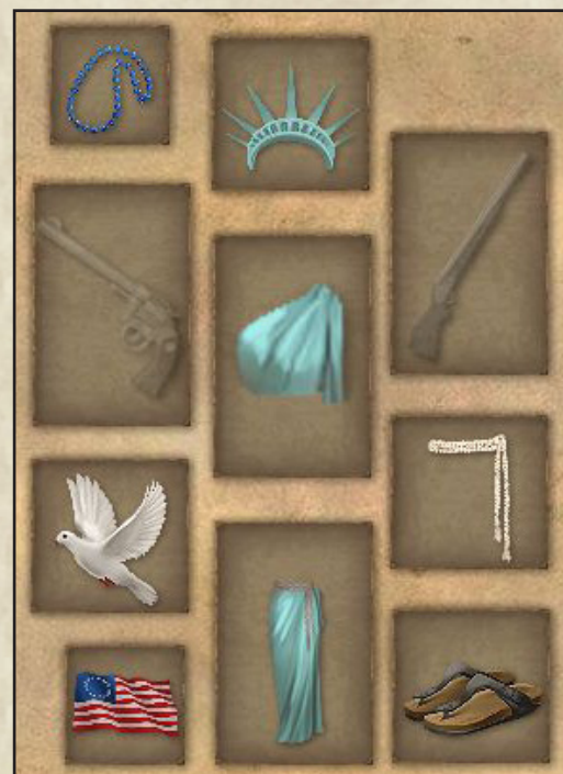
Die „Freiheitsstatue“ im Spiel

https://de.wikipedia.org/wiki/Freiheitsstatue